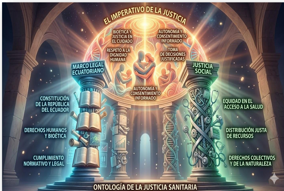
Figura 6. El imperativo de la justicia. Nota: elaborado por los autores con IA (2026). En la imagen se evidencia un esquema integral que fusiona la legalidad, la ética y la equidad para fundamentar el derecho a la salud, estructurado sobre dos pilares fundamentales: el Marco Legal Ecuatoriano (sustentado por la Constitución y los Derechos Humanos) y la Justicia Social (que abarca la equidad y distribución de recursos). En la base, la Ontología de la Justicia Sanitaria sostiene todo el andamiaje teórico. Coronando el modelo, el Imperativo de la Justicia articula conceptos bioéticos centrales como el Respeto a la Dignidad Humana, la Bioética en el Cuidado y la Autonomía con Consentimiento Informado

En esta ocasión, el reto se materializa en la elaboración rigurosa de un producto académico centrado en la aplicación del principio bioético de justicia en el cuidado de los pacientes, integrando un análisis profundo de sus implicaciones sanitarias y jurídicas bajo un estricto rigor metodológico.