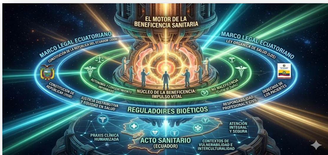
Figura 8. Motor de la beneficencia sanitaria. Nota: elaborado por los autores con IA (2026). La imagen evidencia un motor biofísico de la beneficencia sanitaria, donde el núcleo cálido y vital de la intención de ayuda se transforma en el "Acto Sanitario en Ecuador" (humanizado y seguro). Un escudo hexagonal de "Epistemología de la Salud" (El Filtro Crítico de Juicio Clínico y Bioética) media constantemente la tensión entre la evidencia sólida y el caos de la realidad médica de cada paciente, integrando los principios constitucionales y los derechos humanos en la praxis sanitaria en Ecuador.

Este trabajo busca mostrar cómo la ética, la clínica y la normativa convergen para asegurar una atención oportuna, humana y centrada en el bienestar de la persona.