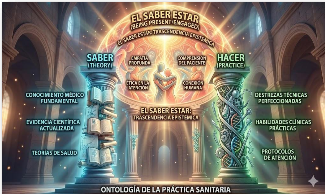
Figura 4. El Saber estar. Nota: elaborado por los autores con IA (2026). En la imagen se evidencia un templo trinitario de la práctica sanitaria, donde el "Saber Estar" se posiciona como la cúpula que une y trasciende las dos columnas de apoyo: el "Saber" y el "Hacer".

carismático o una habilidad blanda, sino una forma de conocimiento situado y relacional.