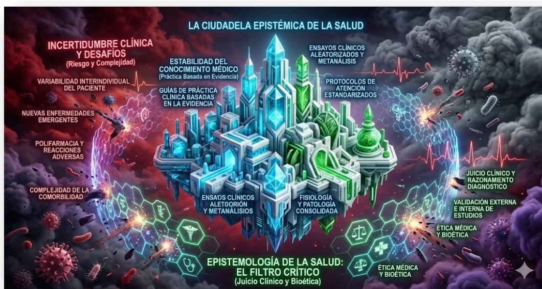
Figura 3. Ciudadela Epistémica de la Salud. Nota: elaborado por los autores con IA (2026). En la imagen se observa una ciudadela fortificada para representar la "Estabilidad del Conocimiento Médico" (Guías Clínicas, Metaanálisis), construida con estructuras bio-arquitectónicas lúcidas que se defiende contra las fuerzas turbulentas y oscuras de la "Incertidumbre Clínica" (Rojo sangre, patógenos, variabilidad del paciente). Un escudo hexagonal de "Epistemología de la Salud" (El Filtro Crítico de Juicio Clínico y Bioética) media constantemente la tensión entre la evidencia sólida y el caos de la realidad médica de cada paciente.

Hoy, frente al desarrollo vertiginoso de la tecnología, enfrentamos la "crisis mundial de la educación" descrita por Coombs (2006). La educación en salud no puede darse aislada de un mundo real y cambiante; los modelos conceptuales deben responder a la complejidad de la realidad, integrando el saber hacer con un fundamento científico interdisciplinario, pero sin dejar de lado la esencia: el cuidado.