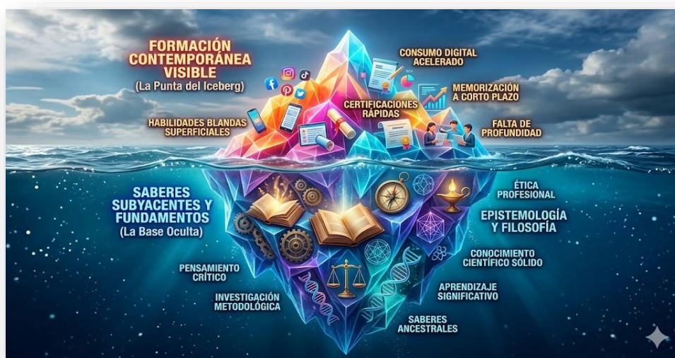
Figura 1. Iceberg de los saberes. .Nota: elaborado por los autores con IA (2026). Esta imagen refleja contraste entre la formación visible y superficial, la inmensa base de saberes fundamentales y necesarios, sumergida en profundos que genera la crisis de la formación contemporánea, donde lo esencial a menudo queda oculto.

Es prioritario establecer las condiciones básicas que dan soporte a la coherencia y eficacia de los saberes, por cuanto estos deben atender a las necesidades integrales del proceso de formación de los dicentes. Esta sustentación teórica no es un ejercicio meramente abstracto; sirve de base y justifica la toma de decisiones cuando se intenta dar solución a un problema de salud bajo un enfoque disciplinario e interdisciplinario. Lo anterior induce a tener claro el trasfondo ontológico y epistemológico como una unidad dialéctica que se complementa como parte de un todo, evitando que la praxis se reduzca a un activismo carente de sentido ético y legal.