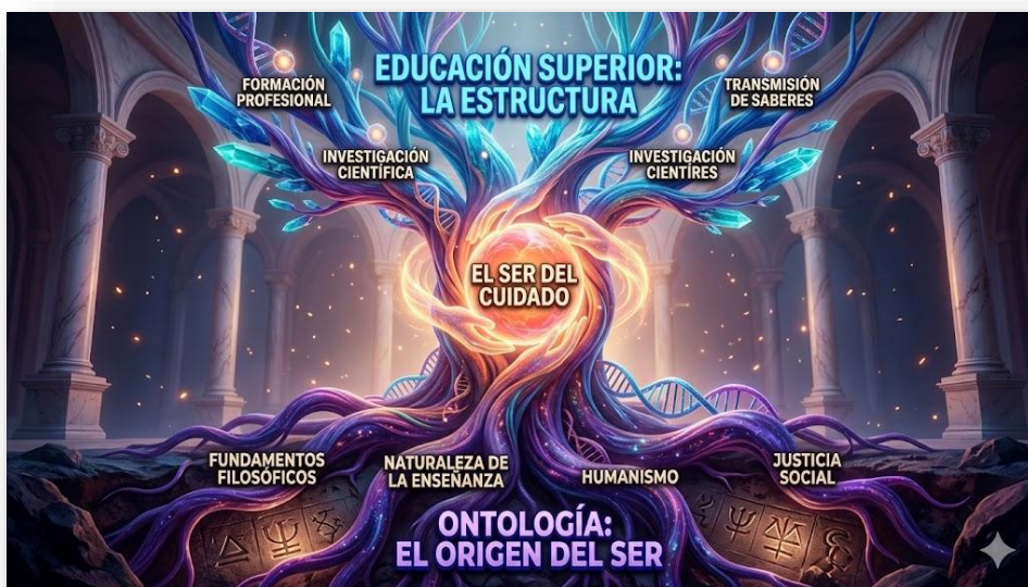
Figura 2. Educación Superior: La Estructura. Nota: elaborado por los autores con IA (2026). La imagen representa la metáfora de un árbol estructural, donde las raíces profundas representan los fundamentos ontológicos y filosóficos del ser, y el tronco y las ramas simbolizan la estructura académica. En el centro neurálgico, una esfera de luz cálida representa el núcleo vital del cuidado, que nutre y da sentido a toda la institución educativa.

Hoy más que nunca esta definición se mantiene vigente, sobre todo en un entorno de salud donde existe la incorporación de la IA generativa con grandes modelos de lenguajes, donde enseñar a pensar constituye el eje de la formación ética (Shaw y McCosker2025). Este planteamiento permite entender que los seres humanos son cocreadores de la realidad en la que se desarrollan y actúan, aportando su experiencia, imaginación y acción.