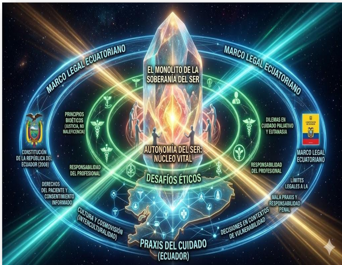
Figura 5. El monolito de la soberanía del ser. Nota: elaborado por los autores con IA (2026). En la imagen se observa un monolito central de cristal que representa la autonomía, rodeado por anillos concéntricos que interactúan con él. El núcleo de la "Autonomía" es cálido y vital, mientras que los anillos éticos (bioética) y legales (marco legal ecuatoriano) actúan como interfaces de tensión y regulación.

En el campo de la atención médica, la autonomía se manifiesta a través de acciones como el consentimiento informado, la protección de la confidencialidad, la posibilidad de rechazar procedimientos y la participación del paciente en las decisiones clínicas.