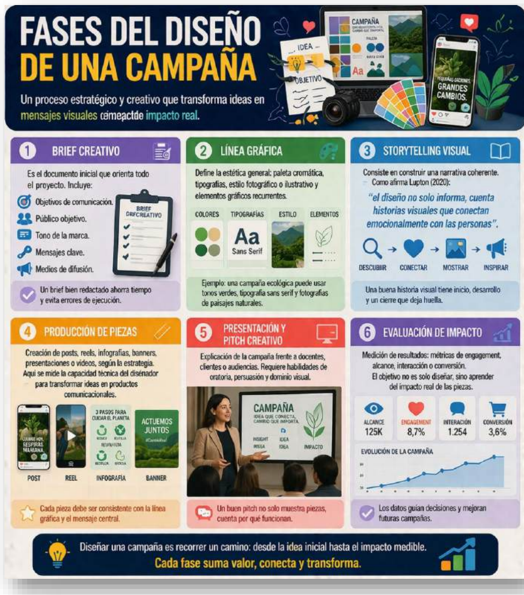
Figura 26. Fases. Nota: elaborado por el autor con IA (2026)