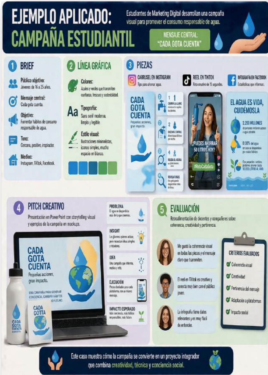
Figura 28. Ejemplos. Nota: elaborado por el autor con IA (2026)