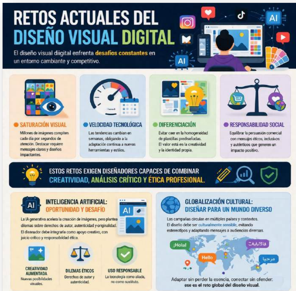
Figura 7. Retos actuales del diseño visual digital. Nota: elaborado por el autor con IA (2026)