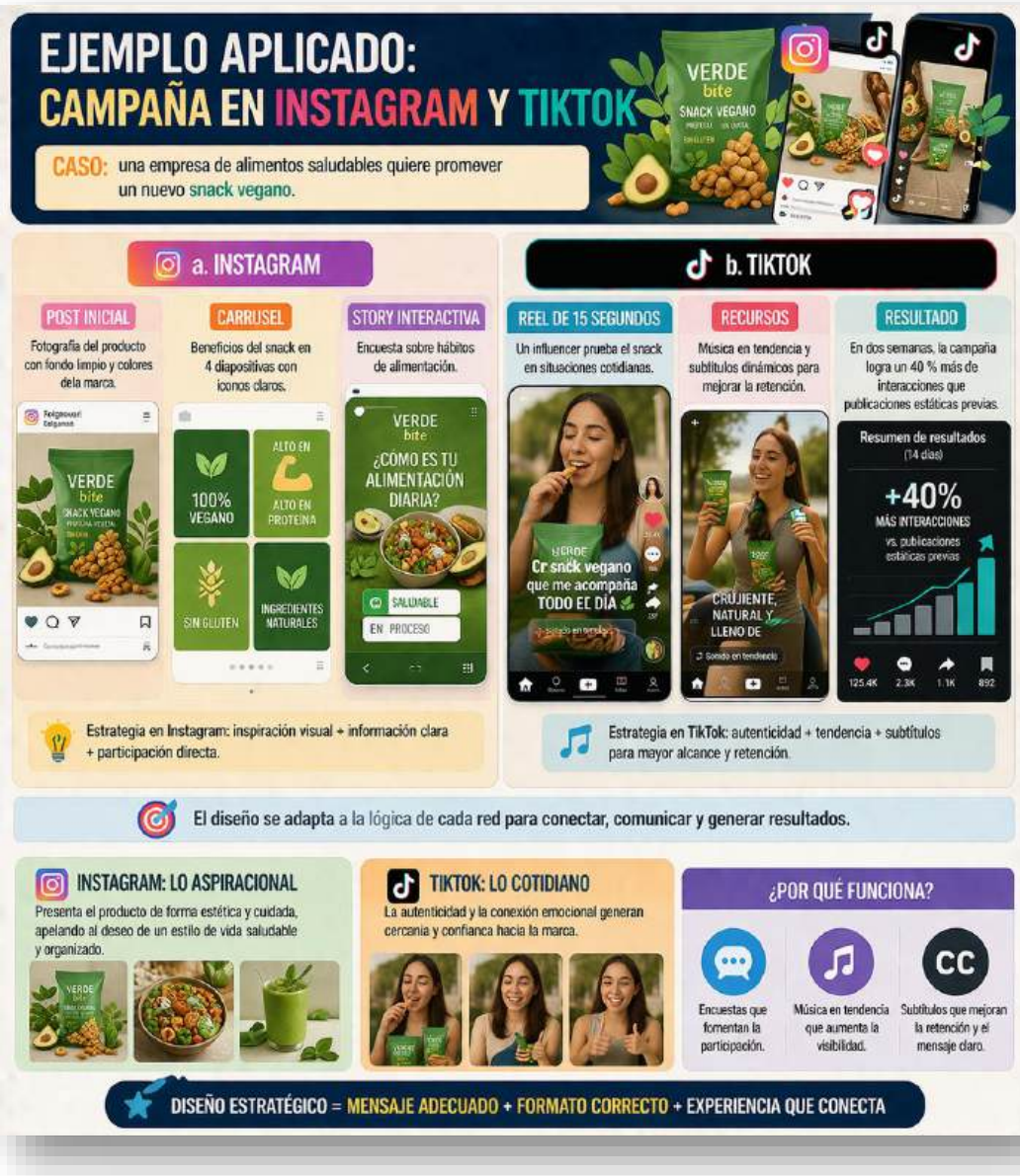
Figura 20. Ejemplo aplicado. Nota: elaborado por el autor con IA (2026)