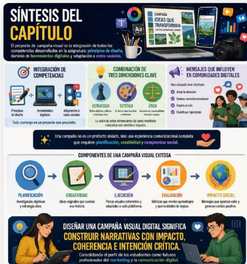
Figura 31. Resumen de capítulo. Nota: elaborado por el autor con IA (2026)

En definitiva, diseñar una campaña visual digital significa construir narrativas con impacto, coherencia e intención crítica, consolidando el perfil de los estudiantes como futuros profesionales del marketing y la comunicación digital.