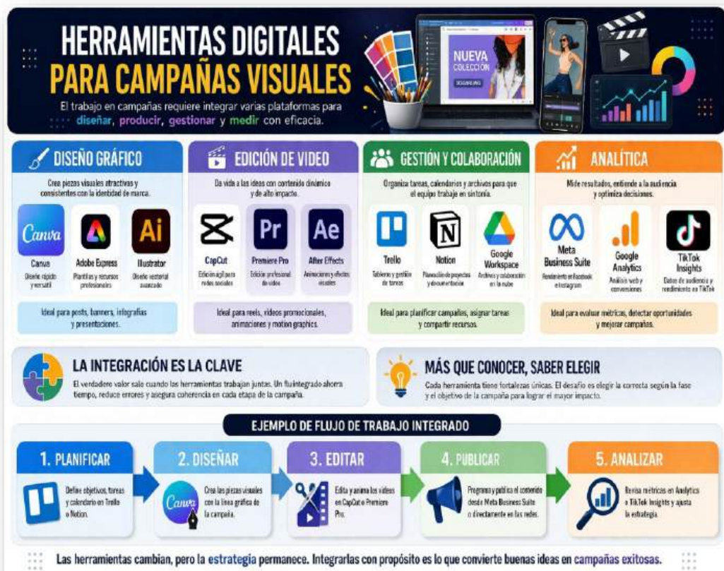
Figura 27. Herramientas. Nota: elaborado por el autor con IA (2026)

Cada plataforma digital aporta fortalezas específicas y el desafío para el diseñador es aprender a combinarlas con criterio, optimizando tiempo, recursos y calidad en el resultado final.