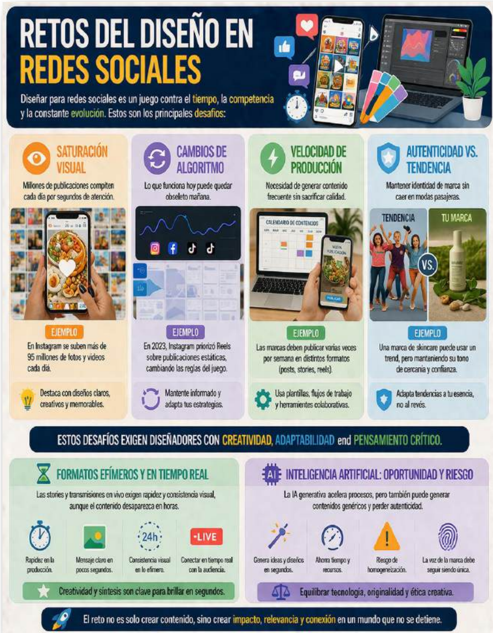
Figura 23. Retos del diseño en redes sociales. Nota: elaborado por el autor con IA (2026)