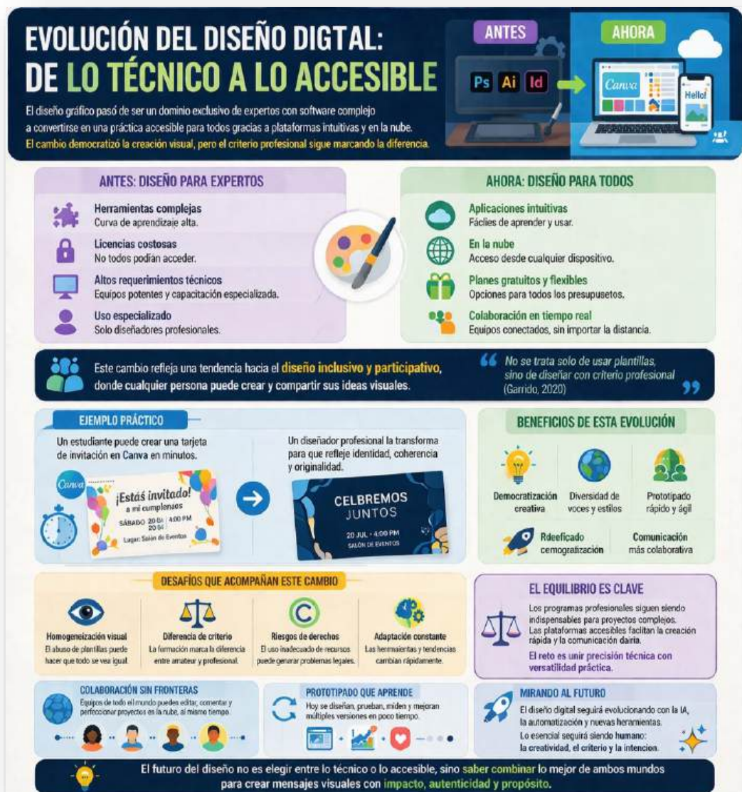
Figura 9. Evolución del diseño digital. Nota: elaborado por el autor con IA (2026)

Los programas profesionales continúan siendo indispensables para proyectos complejos y de alto nivel, mientras que las plataformas intuitivas facilitan la comunicación cotidiana y la gestión rápida de contenidos. El desafío actual es que los futuros diseñadores aprendan a moverse entre estas dos realidades, combinando precisión técnica con versatilidad práctica.