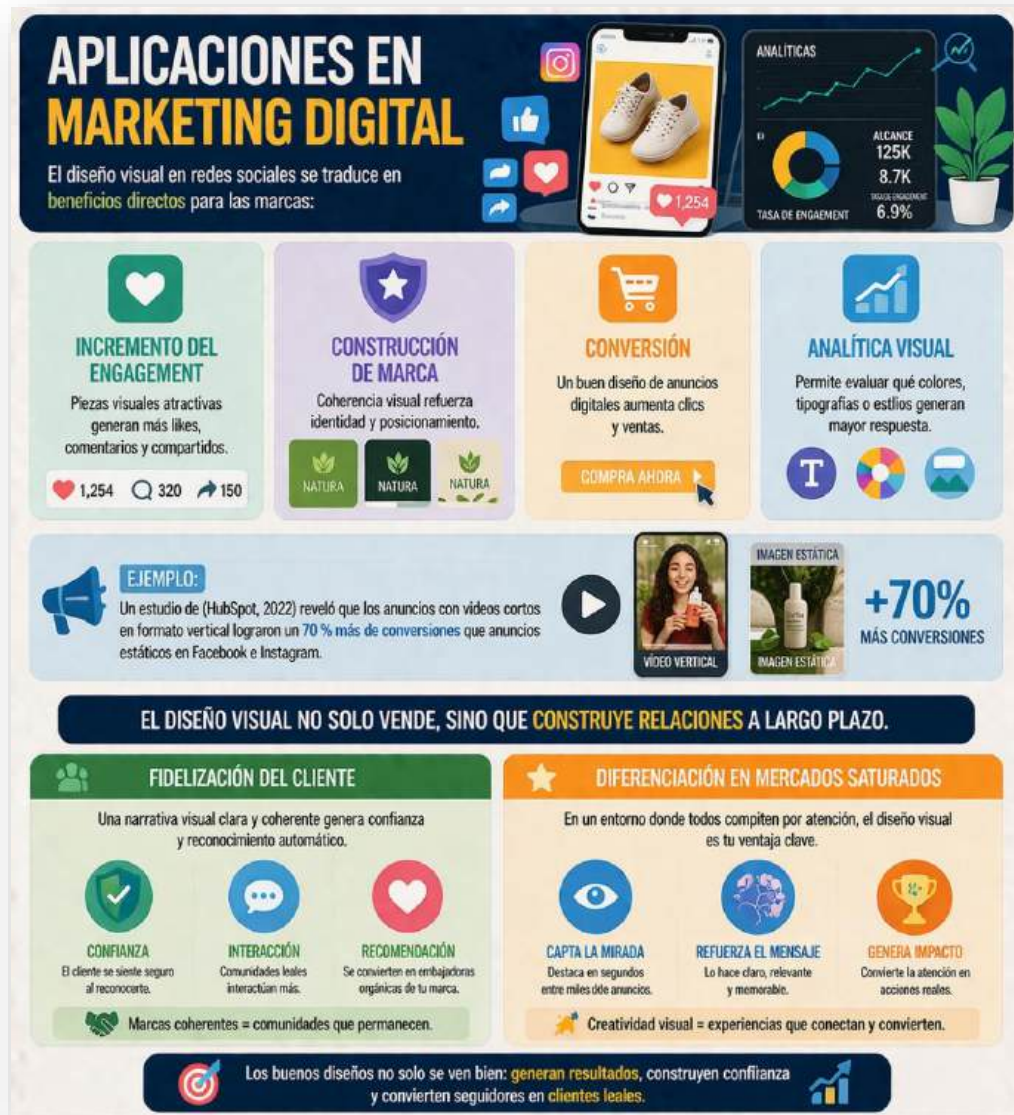
Figura 22. Aplicaciones en marketing digital. Nota: elaborado por el autor con IA (2026)