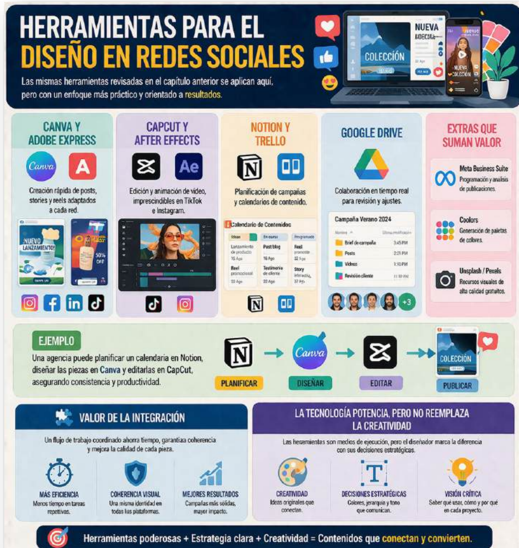
Figura 19. Herramientas para el diseño en redes sociales. Nota: elaborado por el autor con IA (2026)