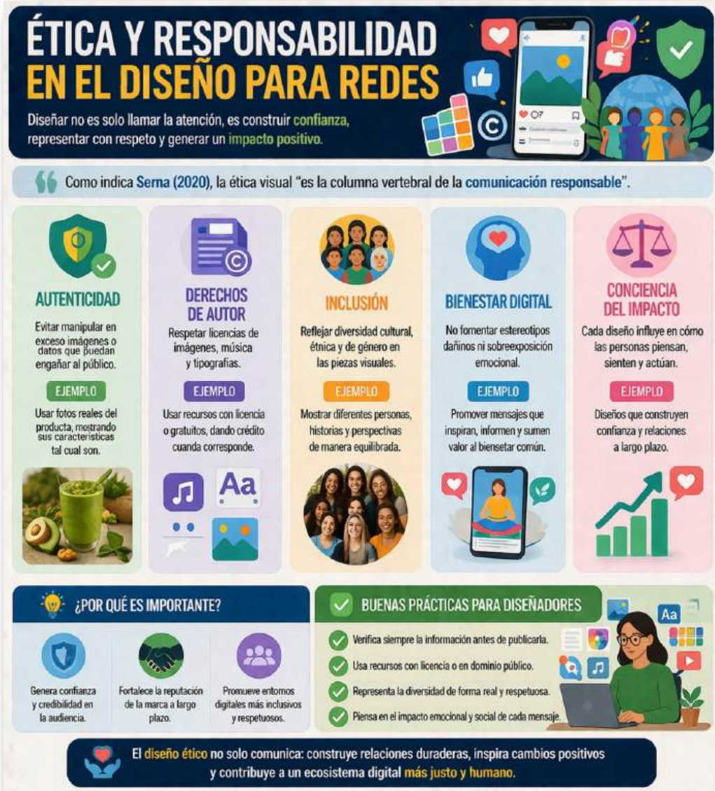
Figura 21. Ética y responsabilidad en el diseño para redes. Nota: elaborado por el autor con IA (2026)